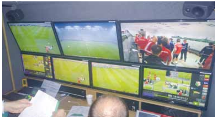
Asystenci VAR przed meczem Legia Warszawa - Lechia Gdańsk w 37. kolejce Lotto Ekstraklasy