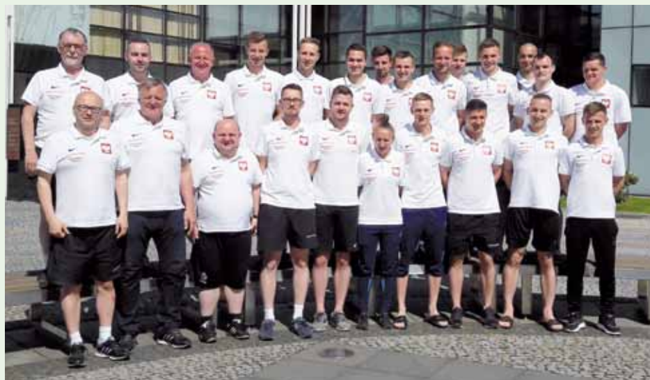
Rodzinne zdjęcie uczestników kursu