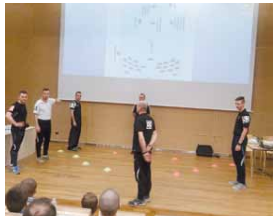
JH Sędziowie na scenie - nowa, praktyczna forma szkolenia.