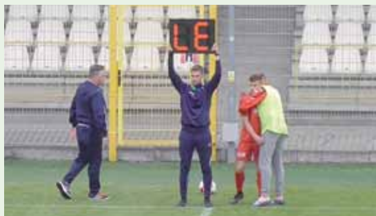
To nie Ligi Europy, ale mecz CLJ. Sędzia techniczny chciał pokazać, że nr 37 ma zejść z boiska...