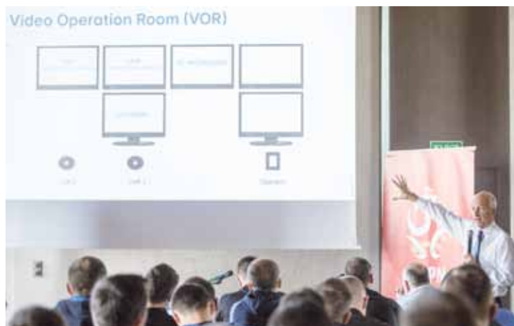
David Elleray w Warszawie długo tłumaczył, jak działa system VAR

System wideopowtórek wejdzie w życie również u Polse – to już pewne. Kiedy? Jak najszybciej! Intensywne szkolenie sędziów i pierwsze próby już trwają. Gdy Kolegium Sędziów PZPN będzie gotowe na tę rewolucję i International Board wyrazi na to zgodę, asystenci wideo wkroczą do akcji na prawie wszystkich meczach Ekstraklasy.