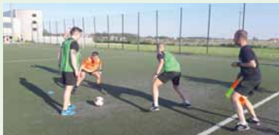
... i z chęcią wykonywali wszystkie ćwiczenia.