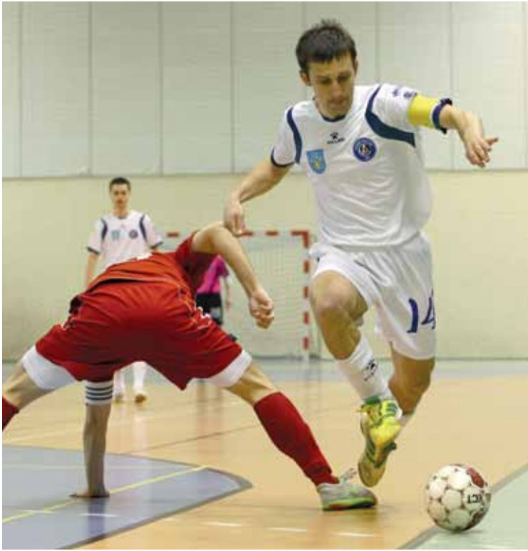
Nowy sezon futsalowy, nowe emocje i nowe... przepisy coraz bliżej!

którzy udzielali im wskazówek. Czekają nas kłopot bogactwa wyboru – mówili po kwietniowym posiedzeniu członkowie Zespołu Futalu KS PZPN.