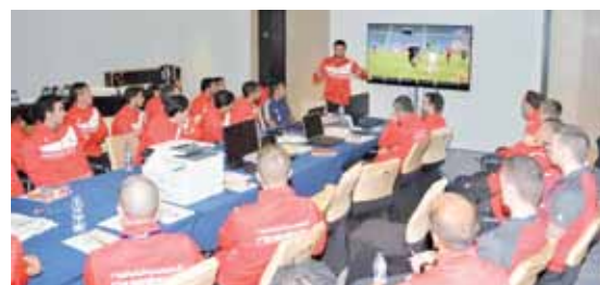
Profesjonalne pomeczowe omawianie

– Chciałbym podziękować Kolegium Sędziów Pomorskiego Związku Piłki Nożnej, który miał spory udział w tym, że dostrzeżono mnie i mogłem uczestniczyć w tak wielkiej piłkarskiej imprezie oraz wszystkim ko-