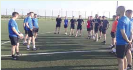
Kursanci pilnie słuchali nowych instruktorów FIFA...